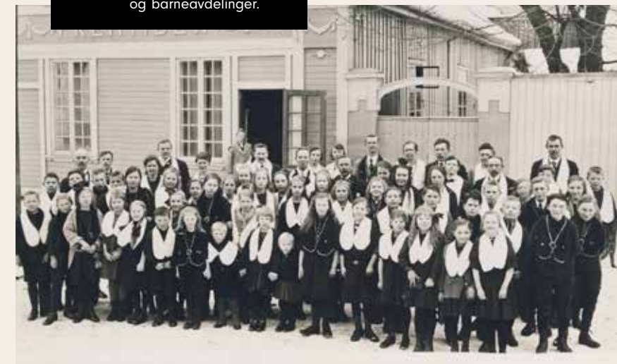
IOGT startet opp både voksen- // og barneavdelinger.

Etter stiftelsen spredte IOGT seg raskt rundt om i landet. Da Carl Reynolds døde litt over 20 år etter var det rundt 400 avdelinger med 25 000 medlemmer som kunne ta farvel med stifteren.