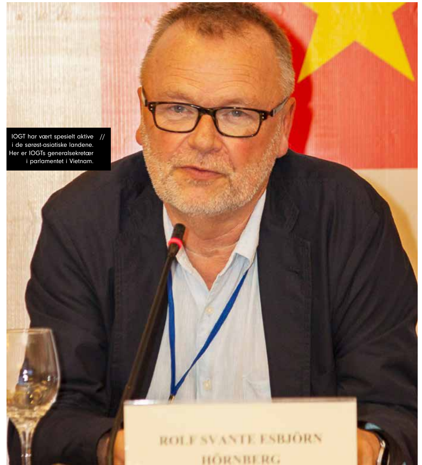
IOGT har vært spesielt aktive // i de sørøst-asiatiske landene. Her er IOGTs generalsekretær i parlamentet i Vietnam.

Utviklingen i IOGT International fra 80-tallet og til i dag har vært spennende å følge. - I dag bygger vi allianser med organisasjoner som jobber på andre områder, og knytter disse til oss. Samtidig får vi kunnskap som kan føres tilbake til partner-organisasjonene til IOGT-NTO og FORUT. Slik er IOGT del i et større nettverk.