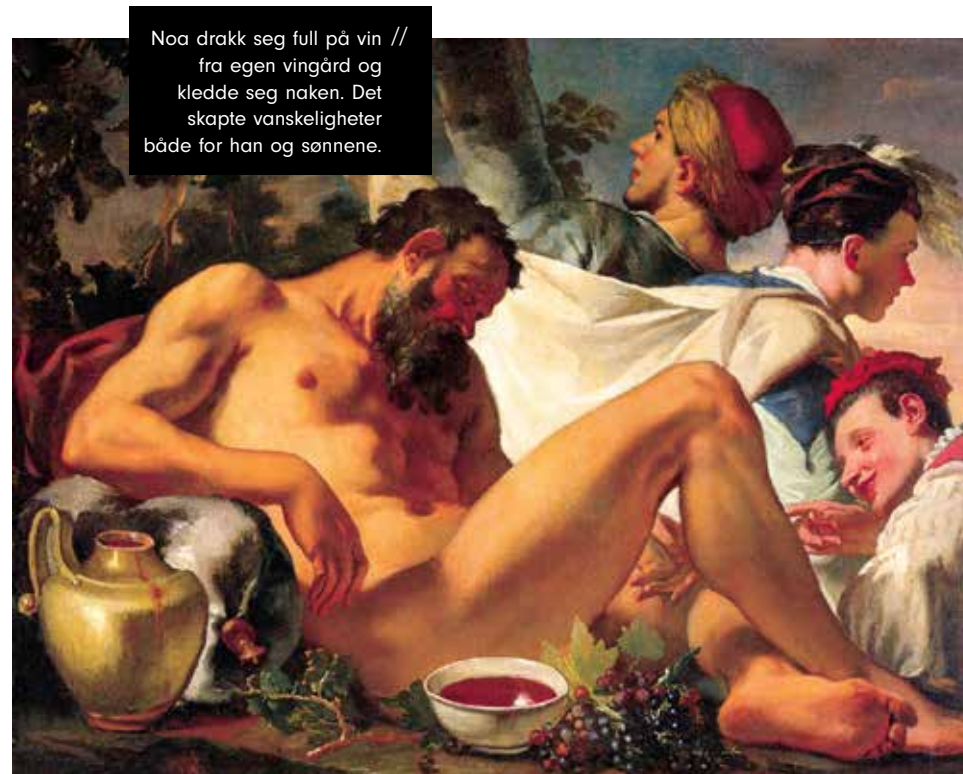
Noa drakk seg full på vin // fra egen vingård og kledde seg naken. Det skapte vanskeligheter både for han og sønnene.

Men nokså raskt har det kommet svar på tiltale, med henvisning til skriftsteder som ser ut til å peke i en annen retning: "Drikk dere ikke fulle på vin; det fører til utskielser" (Ef. 5,18) og "Derfor er det riktig ikke å spise kjøtt eller drikke vin eller gjøre andre ting som fører din bror til fall" (Rom. 14,21). Helt fra Noas dager (1. Mos 9,20 – 27) har misbruk av alkohol ført til at mennesker har kommet i vanskelige situasjoner og fått erfare syndefallets virkninger. Ikke minst har profetene avslørt hva misbruk