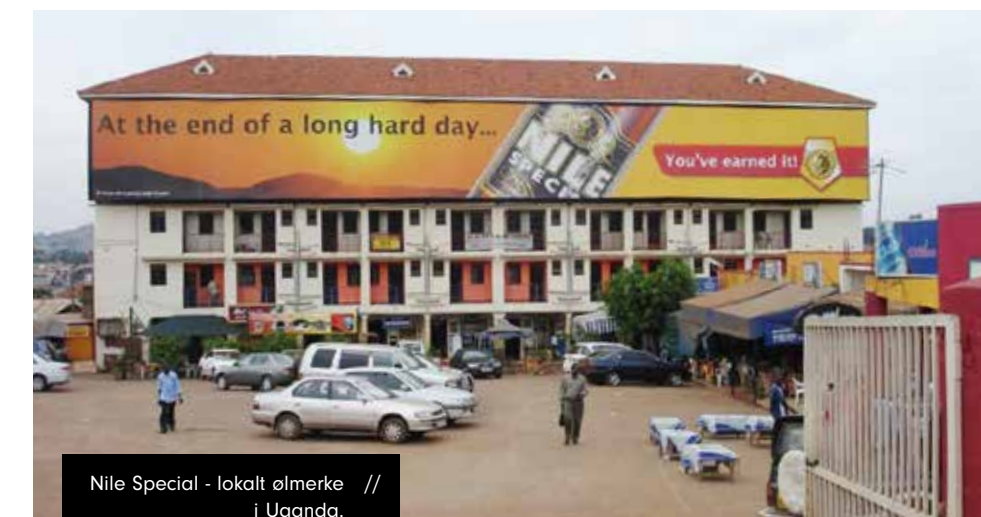
Nile Special - lokalt ølmerke // i Uganda.