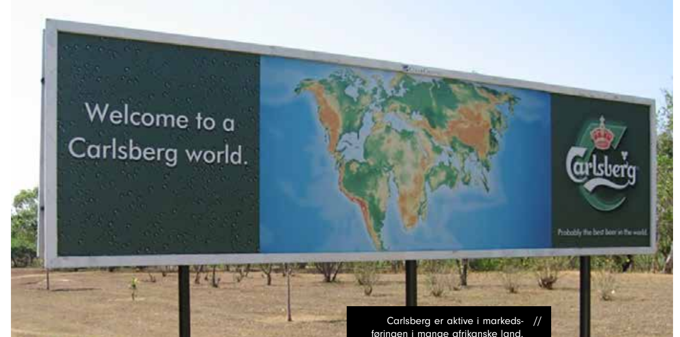
Carlsberg er aktive i markedsføringen i mange afrikanske land.

merer opp det vi i dag vet om virkningen av alkoholreklame, spesielt effekten på forbruket blant unge, de gjennomgår noen konkrete land og eksempler, slik som Fotball-VM i Brasil i 2014, og det gis et sammendrag av hva forskningen sier om effektive mottiltak mot reklamen.