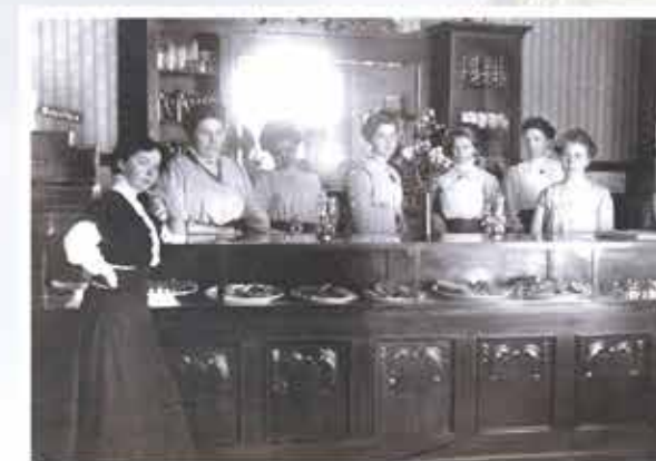
Selskapets medarbeidere i restaurantlokalet tidlig på nittenhundretallet